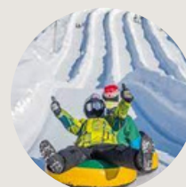
Super glissades Saint Jean de Matha 1h30 de Montréal