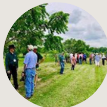
Au jardin des noix 1h de Montréal