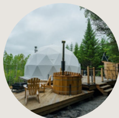
Les Versants de la Falaise