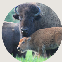
Terre des bisons 50min de Montréal