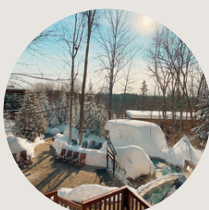
La Source Bains Nordiques SPA 1h35 de Montréal