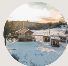
2800 du Parc