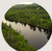
Méandre Haute-Mauricie 4h de Montréal