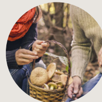
Mycotourisme Mauricie Variable selon le lieu