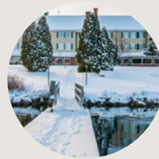
Auberge du Lac à l'eau claire