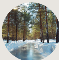
Domaine enchanteur 2h30 de Montréal