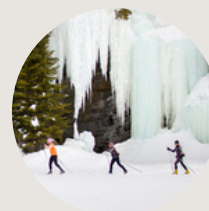
Location de raquettes Parc de la Mauricie 2h20 de Montréal