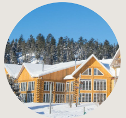
Auberge du Vieux Moulin