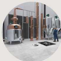
Distillerie le Grand Dérangement 1h de Montréal