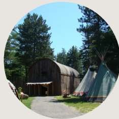
Auberge Refuge du Trappeur