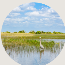
Domaine du lac Saint-Pierre 1h de Montréal