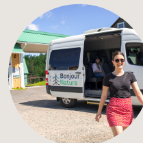
Bonjour Nature Excursion d'un jour au départ de Montréal Métro Radisson