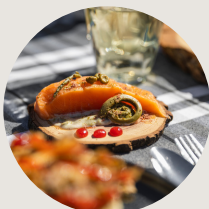
La Forêt de l'Abbaye 1h15 de Montréal