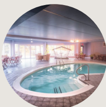
SPA Santé de l'Auberge de la Montagne Coupée 2h de Montréal