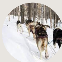
Aventures liguoriennes 1h de Montréal